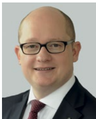
Udo Bausch Oberbürgermeister Stadt Rüsselsheim am Main